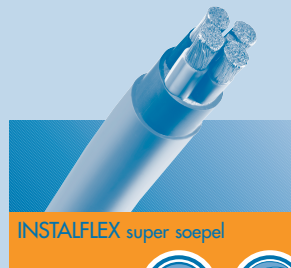
INSTALFLEX super soepele

Ondanks duidelijke verschillen in constructie en buigbaarheid maakt de officiële typeaanduiding geen onderscheid tussen de TKF standaard TWENKAPLUS soepele kabels en de INSTALFLEX super soepele kabels. Voor beide soorten geldt daarom dezelfde typeaanduiding YMvK mb ss 0,6/1 kV! Beide soorten kabels mogen ook ingezet worden in voedings-installaties tot 1.000 Volt indien NEN 1010 van toepassing is. Bovendien zijn beide uitvoeringen qua constructie, mechanische en elektrische eigenschappen en materiaalgebruik gelijk of beter ten opzichte van conventionele uitvoeringen.