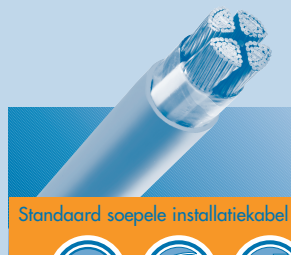
Standaard soepele installatiekabel