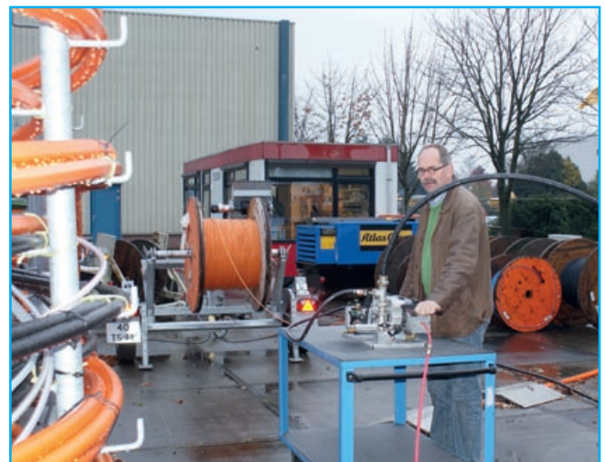
ACE Testanlage von TKF