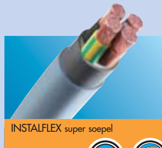
INSTALFLEX super soepel