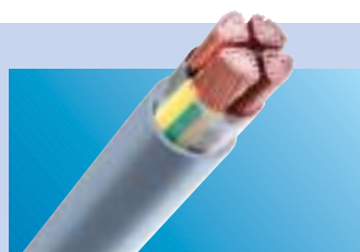
Standaard soepele installatiekabel

Zie www.tkf.nl of vraag de brochure soepele installatiekabels aan.